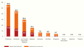
(ASEAN, UNICEF, & WFP, 2022, fig. 11)

La falta de acceso al alimento afecta en niveles distintos a todas las naciones que componen ASEAN. El siguiente gráfico de ASEAN, UNICEF y WFP (2022) esclarece este supuesto: